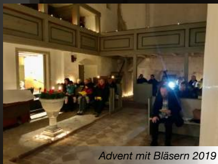
Advent mit Bläsern 2019

In der kleinen romanischen Kirche wird in Zeiten, die nicht von der Pandemie belastet sind, in die „Kleine Kirche“ zur Wochenschlussandacht eingeladen. Woanders würde der Raum als Winterkirche bezeichnet. Da er aber ganzjährig genutzt wird, musste eine andere Bezeichnung her. Am ersten und dritten Samstag des Monats um 18.00 Uhr finden sich in Friedenszeiten also über zehn Gemeindeglieder ein. Weil nun der Raum so klein ist, hat jeder das Gefühl, der Gottesdienst ist gut besucht. Das ist er auch, denn etwa die Hälfte der Gemeindeglieder nimmt daran teil. Der GKR kam vor 8 Jahren auf die Idee, von der unwirtlichen Zeit am Sonntag (9.00 Uhr) auf die Samstage auszuweichen und damit auch den Gemeindegliedern