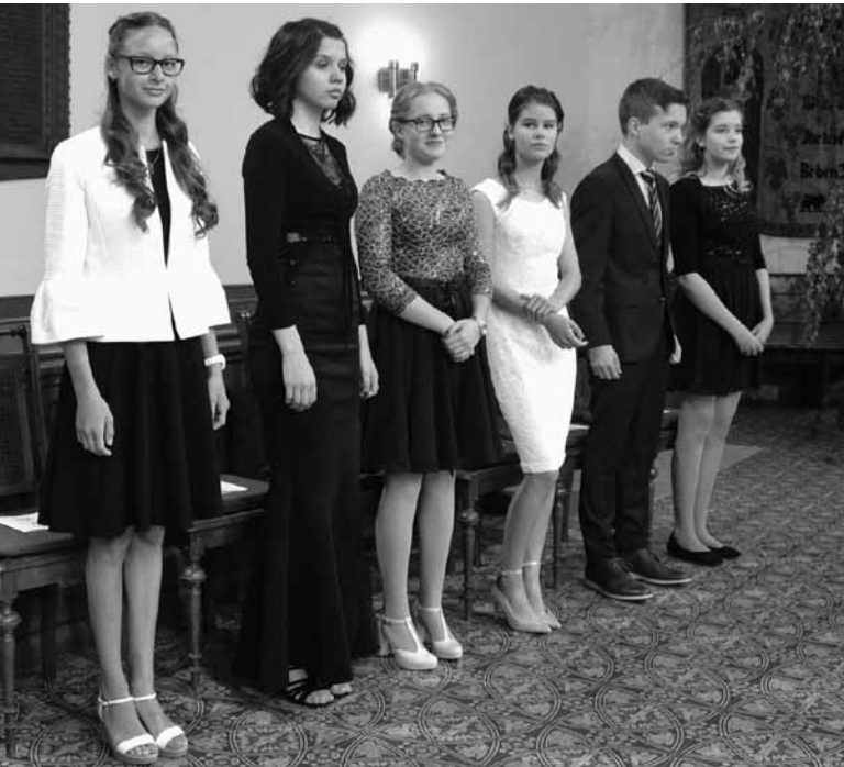
Konfirmation Pfingsten 2018 (Martinskirche Bernburg)