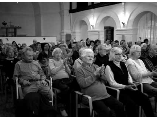
Der gut gefüllte Stiftungssaal während der Feierstunde, darunter viele Besucher, Gäste und Angehörige.