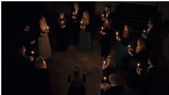
O du stille Zeit - Adventskonzert - Kammerchor Wernigerode - Schlosskirche St. Aegidien, Sa, 16.12., 17 Uhr